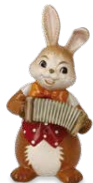
Frecher Musikant Cheeky Accordeon Player Accordéoniste coquin

8 cm 24.001375.0.802.1 · VE2 66-845-78-1