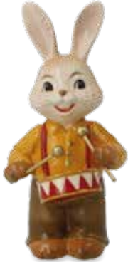
Herziger Trommler Cute Drummer Le mignon tambour

8 cm 25.001375.0.802.4 · VE2 66-845-97-1