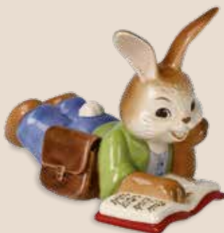
Du bist Klasse! You are great! Tu es génial!

12,5 x 8,5 cm 25.001750.0.802.1 · VE1 66-846-09-1