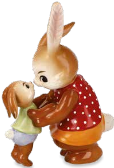
Kleiner Schatz Precious Darling Petit trésor 12 cm 23.002500.0.802.1 • VE1 66-845-51-1