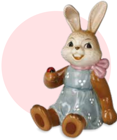
Glückskind Lucky Child Porte bonheur 10 cm 25.001500.0.802.1 • VE1 66-846-07-1