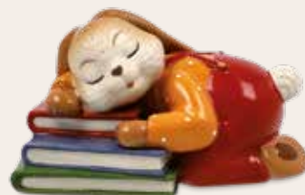
Kurze Pause Short Break Courte pause

10 x 6 cm 24.001750.0.802.1 · VE1 66-845-85-1