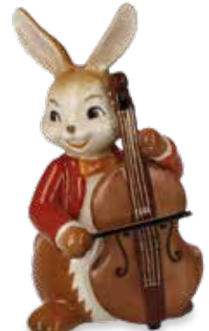
Fröhlicher Bassist Happy Bassist Joyeux contrebassiste

8 cm 24.001375.0.802.1 · VE2 66-845-80-1