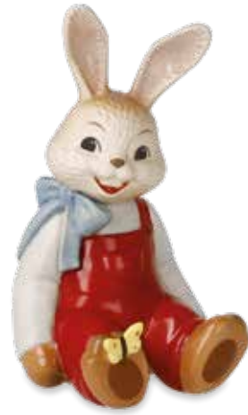
Mein kleiner Freund My little Friend Mon meilleur ami 11 cm 25.001500.0.802.1 • VE1 66-846-08-1