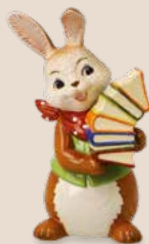
Hoppla! Oopsie-Daisy! Oops!

12 cm 23.001750.0.802.1 · VE1 66-845-43-1