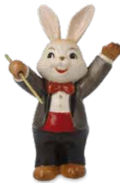
Genialer Dirigent Brilliant Conductor Maestro génial

8 cm 25.001375.0.802.4 · VE2 66-845-99-1