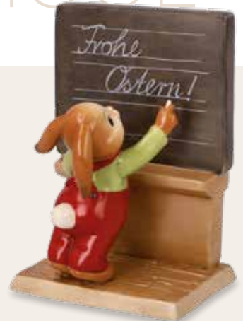
Das wünsch ich Dir My Wish For You Mon vœu pour toi

14 cm 23.002250.0.802.1 · VE1 66-845-44-1