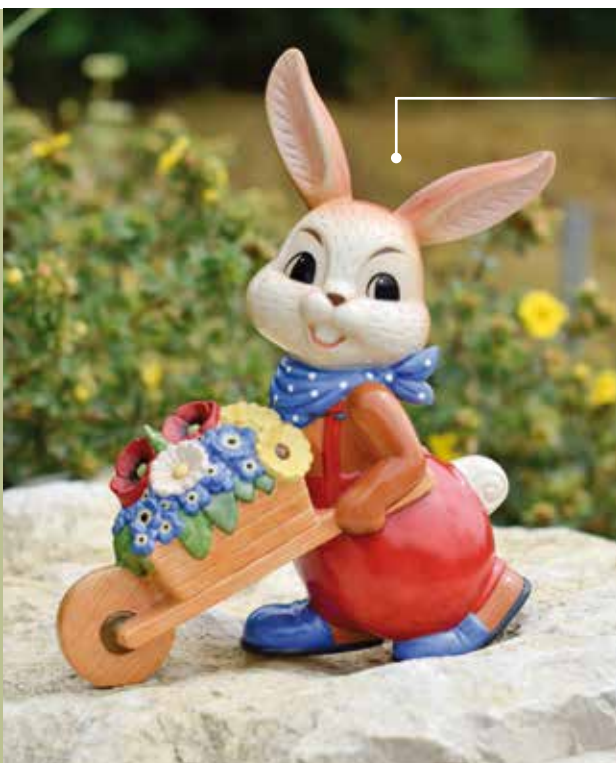
So schön ist der Frühling Spring Is So Beautiful Le printemps est magnifique 25 cm 23.005950.0.802.1 · VE1 66-845-58-1