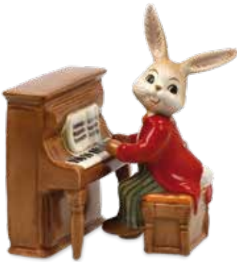
Kleiner Virtuose Little Virtuoso Petit Virtuose

6 x 9 cm Zweiteilig | two pieces | deux pièces 24.002500.0.802.1 · VE1 66-845-81-1