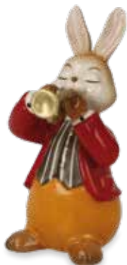
Eifriger Trompeter Eager Trumpeter Trompettiste enthousiaste

8 cm 24.001375.0.802.1 · VE2 66-845-77-1