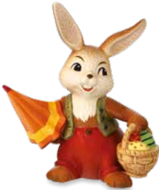
Bald bin ich da Be There Soon J'arrive 15 cm 23.002125.0.802.7 · VE1 66-845-56-1