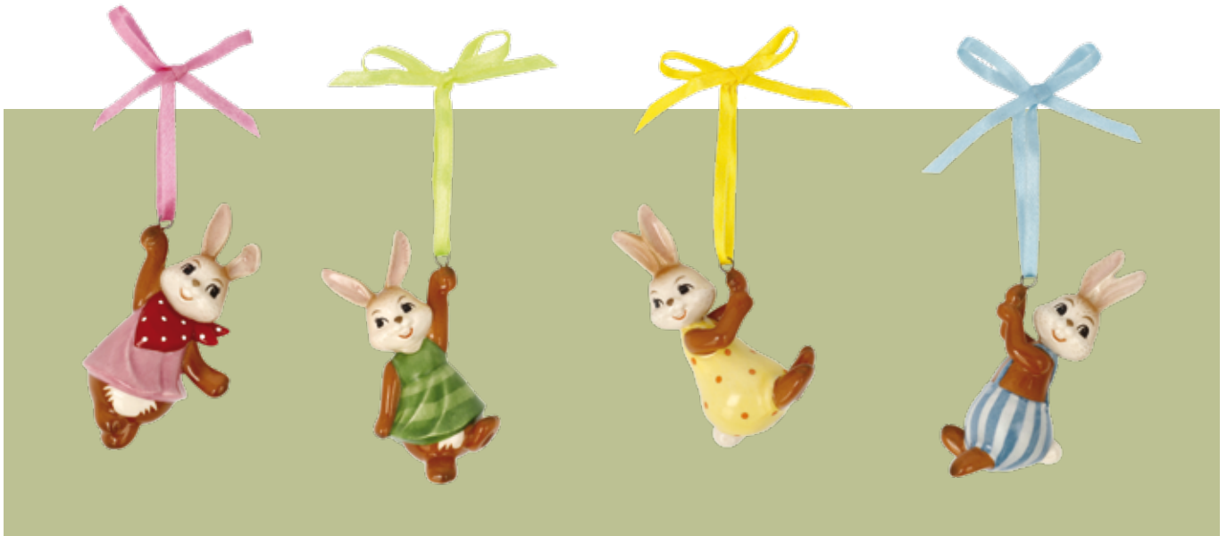
Akrobatin Acrobat L'acrobate 7,5 cm 66-845-74-1 S