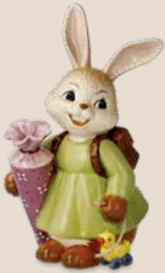
Erster Schultag First School Day Premier jour d'école

12 cm 25.001750.0.802.4 · VE1 66-846-10-1