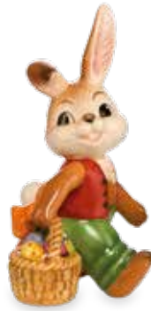
Osterbescherung Easter Surprise Surprise de Pâques 11,5 cm 17.001750.0.802.1 · VE1 66-843-48-1