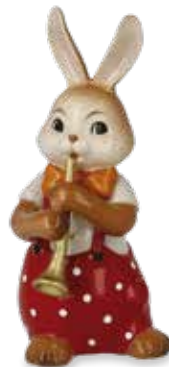
Süßer Flötenspieler Cute Flute Player Mignon joueur de flûte

8 cm 24.001375.0.802.1 · VE2 66-845-79-1