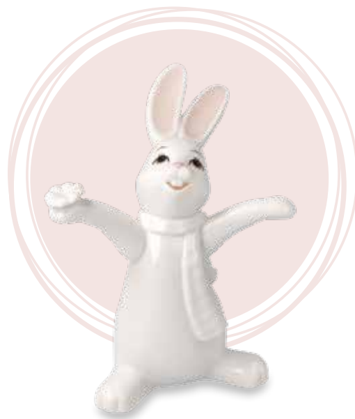
Oh Happy Day!

14 cm 23.001500.0.817.7 • VE1 66-845-60-1