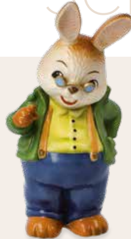
Fein gemacht! Well Done! Bravo!

16 cm 23.002000.0.802.1 · VE1 66-845-45-1