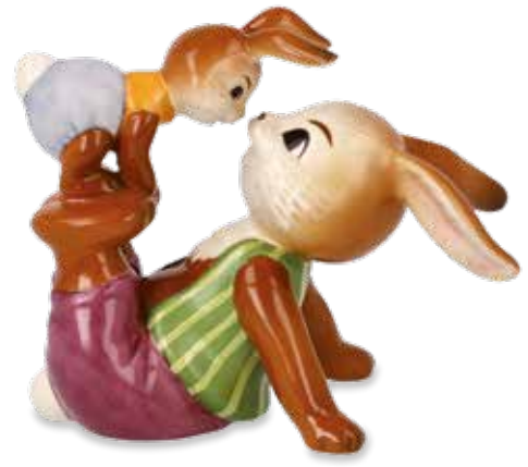
Frechdachs Cheeky Boy Petit coquin 9 cm 23.002500.0.802.1 • VE1 66-845-52-1