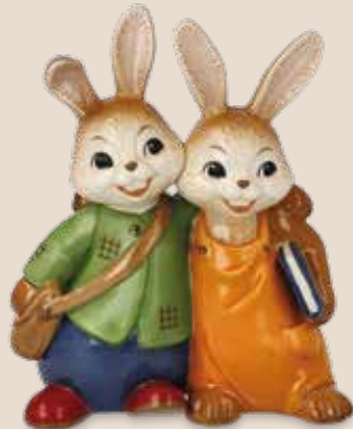
Schulfreunde School Friends Amis d'école

12 cm 24.002750.0.802.1 · VE1 66-845-86-1