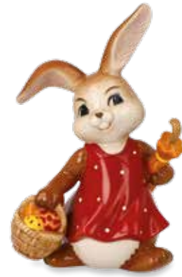
Unterwegs zu Dir On My Way to You En route 15 cm 23.002125.0.802.7 · VE1 66-845-55-1