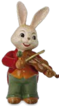
Kleiner Violinist Little Violinist Petit violoniste

8 cm 25.001375.0.802.4 · VE2 66-845-98-1