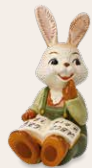
Früh übt sich The Ealier the Better Le plus tôt sera le mieux

10 cm 23.001750.0.802.1 · VE1 66-845-42-1