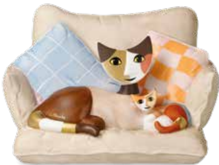
La Mamma e Minni

17 x 10 cm 25.003450.0.575.4 · VE1 31-401-09-1