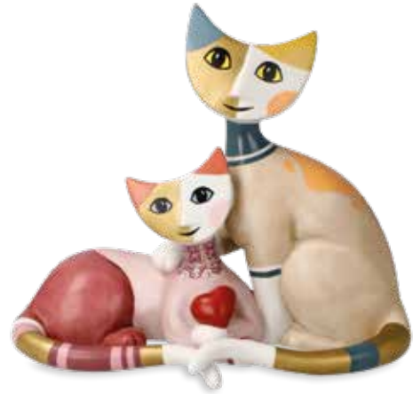
Vivien e Peppie

16 x 14 cm 25.003950.0.575.4 · VE1 31-401-16-1