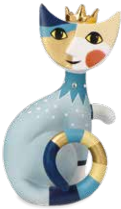
Max il re

13 cm 25.002950.0.575.4 · VE1 31-401-14-1