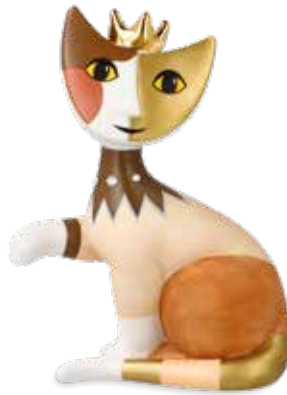
Gina la principessa

12 cm 25.002950.0.575.4 · VE1 31-401-15-1