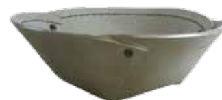
Sirikit • Schale · Bowl · Coupe ø 28 cm • 39-000-02-1 24.006250.0.601.4