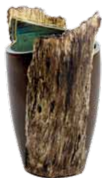
Aranya • Vase

Inspirée directement de la nature, la série de vases Aranya est authentique. Le matériau et l'imitation de structures végétales soulignent les sources essentielles de la vie – la terre fertile et la croissance naturelle.