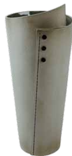
Sirikit • Vase 45 cm • 39-000-05-1 24.014950.0.601.4