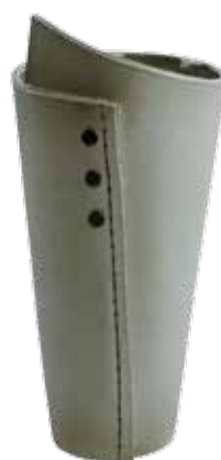
Sirikit • Vase 31 cm • 39-000-04-1 24.007450.0.601.4