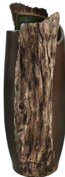
Aranya • Vase