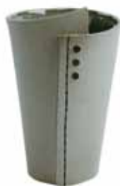
Sirikit • Vase 19 cm • 39-000-03-1 24.003950.0.601.4