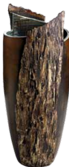
Aranya • Vase